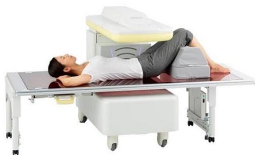
日立アロカメディカル社製 DSC-900FX (腰椎測定)

当院では、骨密度、骨量を測定する高精度な骨塩定量測定装置を備えています。予約は不要、検査時間は5分程度で計測できます。測定部位として、骨折の多い腰と股関節で測定します。