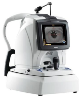
ニデック社製 光干渉断層計 RS-3000Lite

緑内障は日本における失明原因の第1位を占め、 40歳以上の20人に1人 の割合で緑内障の患者さんがいることが報告されています。しかし緑内障であるにもかかわらず、これに気づかずに過ごしている人が大勢いることも判明しました。早期発見・早期治療で失明を防ぎましょう！